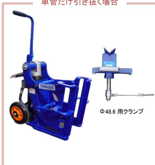
単管だけ引き抜く場合